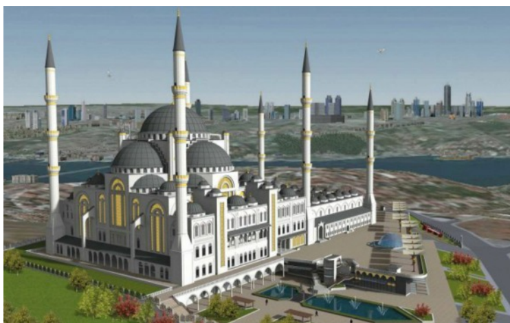
Aiotun suurmoskeijan havainnekuva

”Miksi valtamedia halusi uskotella, että moskeijahanke olisi nyt yllättäen saanut tuulta purjeisiinsa, vaikka maailman tapahtumat ja salafistimoskeijoista kuvatut dokumentit ovat osoittaneet hankkeen kiistattoman haitallisuuden? Tunnusteleeko valtamedia ihmisten reaktioita ja siedättää yleisöään ajatuksella että hanke etenis kaikesta huolimatta? Haluaako valtamedia luoda totuudenvastaisen käsityksen hankkeesta ikäänkuin luonnonvoimana joka vain etenee kaikesta vastustuksesta ja tosiasioista huolimatta?” (oikeamedia.com).